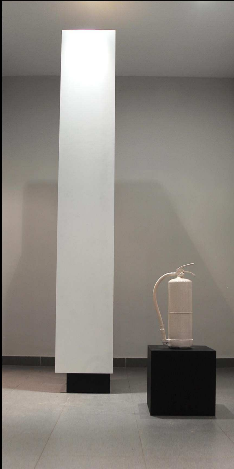
Proyecto: IV BIENAL DE ARTE CONTEMPORÁNEO FUNDACIÓN ONCE Obra: 9399